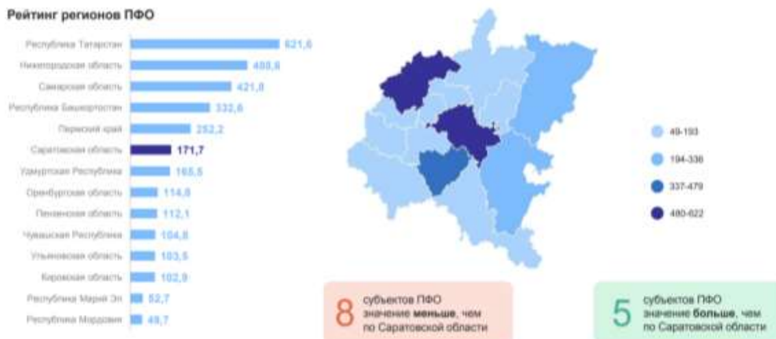
Рисунок 3 – Оборот МСП по регионам ПФО

Таким образом, МСП в Российской Федерации в настоящее время получает активное развитие, чему способствуют меры поддержки, организуемые федеральными и региональными органами власти, именно они стимулируют возникновение всё новых и новых субъектов предпринимательства, что положительно сказывается как на экономике отдельного региона, так и Российской Федерации в целом, а также позволяет стимулировать экспорт российских товаров, что позволяет упрочнить положение Российской Федерации в международной экономике.